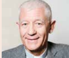
Mgr Luc Ravel archevêque de Strasbourg