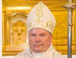
Mgr Yves Baumgarten évêque du Puy-en-Velay